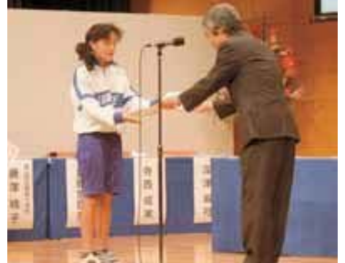
▲学校のワクを超えた活動が高く評価されました。