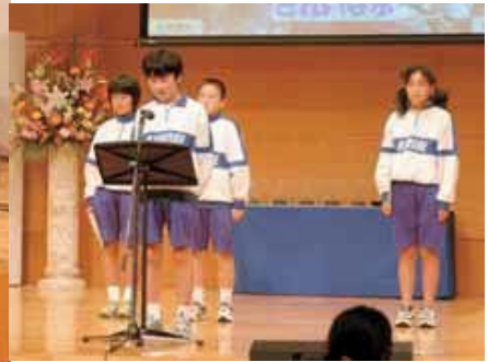
▲おそろいのユニフォームで気持ちもひとつに。