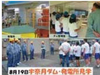
▲黒部川を通して、さまざまな交流 が広がっていきます。