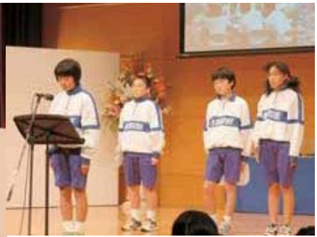
▲団員36名を代表して6年生4名が発表しました。