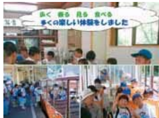
▲みんな楽しい思い出がいっぱい できました。