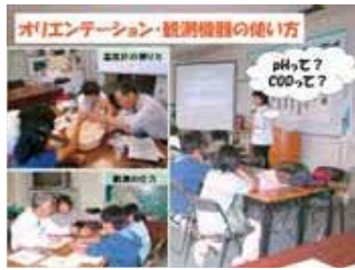
▲まずは観測器具の使い方を教わる ることなどから活動をスタート。