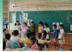
わたしたちに任せてください。