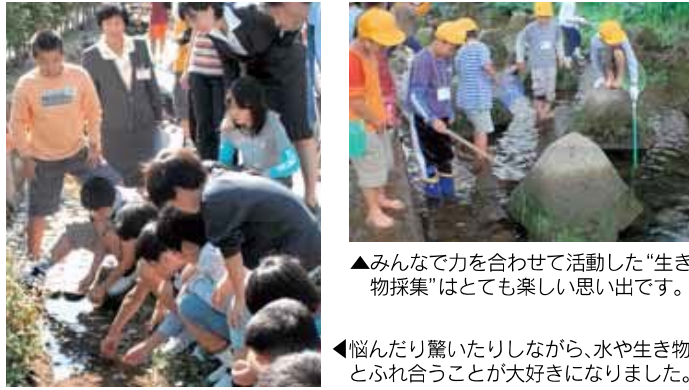
▲みんなで力を合わせて活動した"生き物採集"はとても楽しい思い出です。