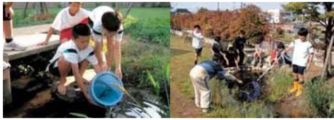
▲ビオトープをいろいろな生き物でいっぱいになろうと活動してきました。