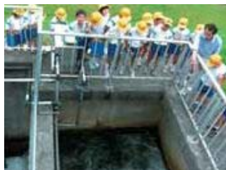
▲庄川の水が、松島浄水場で水道水になる様子を見学しました。