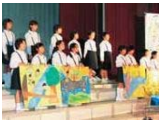
▲庄川に伝わる昔話も調べ、学習発表会で紹介しました。