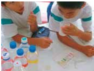
▲採取してきた水で水質検査をしました。