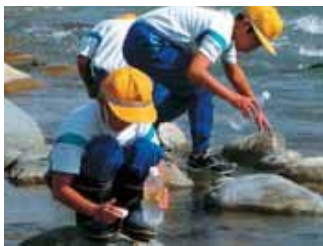
▲岐阜県の源流近くから、新湊の河口までの間5ヶ所で水を採取しました。