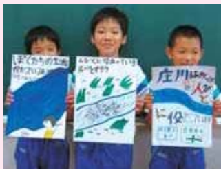
▲ポスターや新聞を作り、庄川を大切にしようと呼びかけました。

ほくは、庄川のことを調べて、庄川が発電や用水、水道水など、いろいろなことに役立っていることや、流送夫の歴史があることを知り、驚きました。そのことを、学習発表会や水みらいプロジェクトで伝えることができ、とてもうれしかったです。これからも、ポスターや新聞で庄川のすごさを伝えていきたいです。