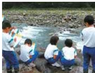
▲庄川の5ヶ所で、川の広さ、石の大きさや形、周りの様子などを観察しました。