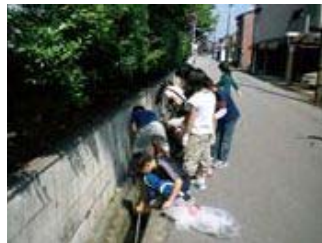
▲校舎周辺のごみ拾いをして、環 境保全に関心を高めました。