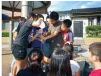
▲透視度計に内川の水を入れて います。どれくらいきれいかなあ。