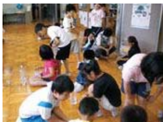
▲自分たちで内川の水質検査 (PACテスト)をしています。12ポ イントで水をくんできて、違いがない か確かめました。