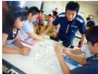
▲海上保安庁の方に授業をして いただきました。4つの水の水質検査 (PACテスト)をしています。