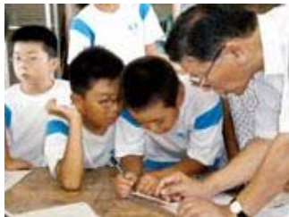
▲県立大学の先生方と透視度計 を作りました。目盛りを正確に付け ています。